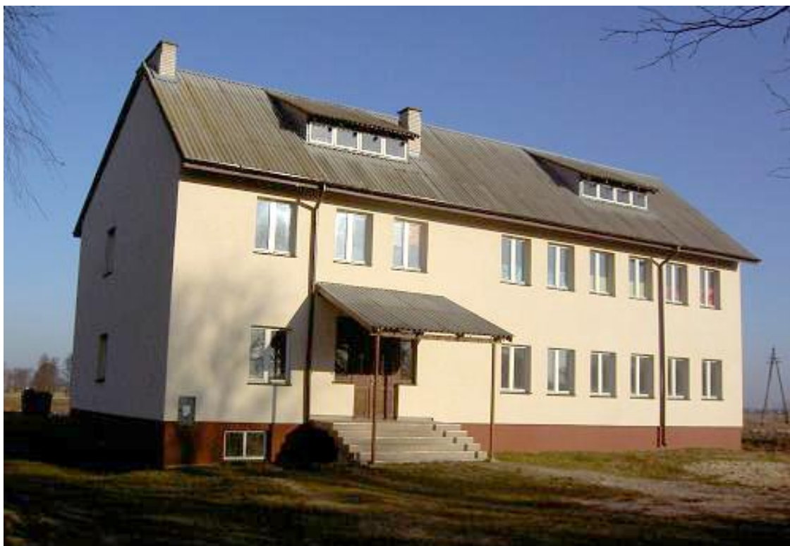
Budynek gminny, w którym została utworzona filia biblioteczna w Polskowoli

W 1988 r. zostaje utworzona czwarta filia Gminnej Biblioteki w miejscowości Polskowola.