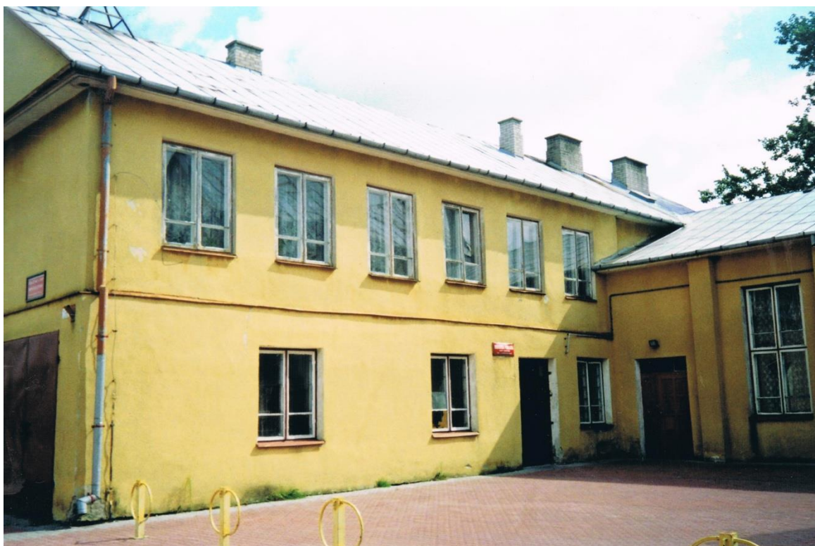
Budynek, w którym mieściła się filia biblioteczna w Brzozowicy Dużej

W 1956 r. zostają założone pierwsze filie biblioteczne w Brzozowicy Dużej i Turowie.