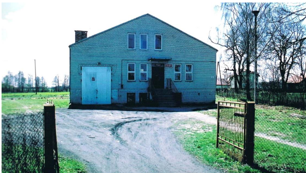
Budynek, w którym mieściła się filia biblioteczna w Turowie