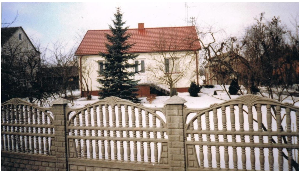
Budynek prywatny, w którym mieściła się biblioteka w latach 1977-1983

W 1973 r. w związku z reformą administracyjną kraju biblioteka zmienia nazwę na Gminną Bibliotekę Publiczną. W 1977 r. kolejny raz zmienia lokal, tym razem znowu do budynku prywatnego.