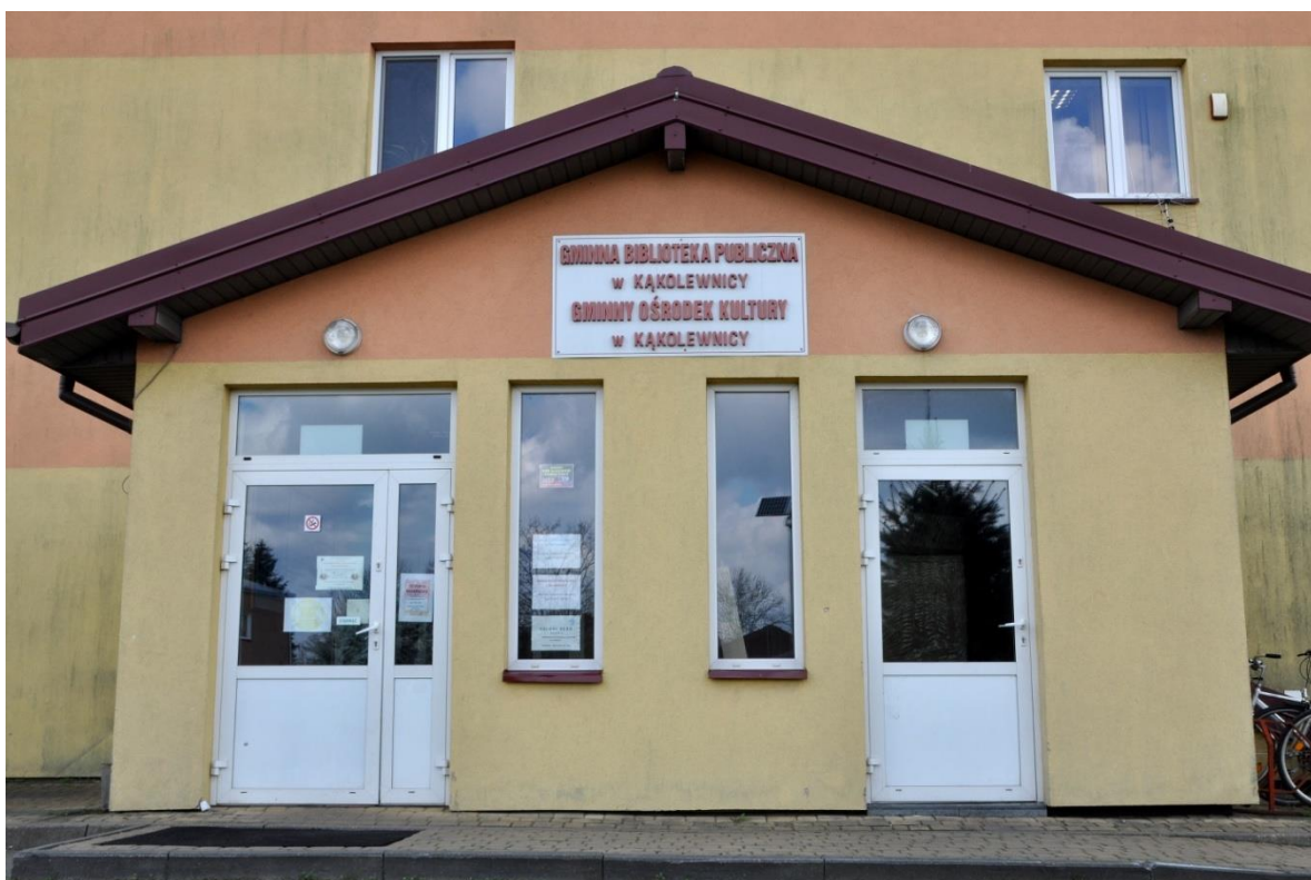
Budynek GOK, w którym mieści się biblioteka od 2011

Ostatnia przeprowadzka miała miejsce w roku 2011 do lokalu mieszczącego się w Gminnym Ośrodku Kultury i Ochotniczej Straży Pożarnej, biblioteka zajmuje jedno przestronne pomieszczenie o pow. 120 m 2 . Przystępuje do „Programu Rozwoju Bibliotek „ – pozyskuje 5 zestawów komputerowych (komputer, urządzenie wielofunkcyjne, aparat cyfrowy).