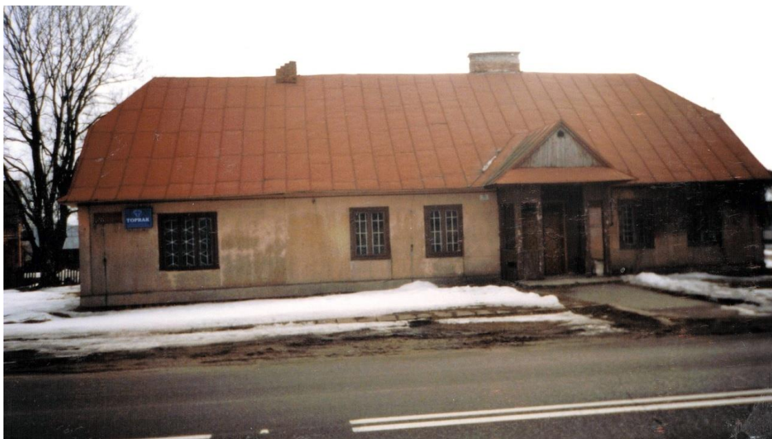
Budynek Gromadzkiej Rady, w którym mieściła się biblioteka w latach 1983-2002

Kolejna przeprowadzka następuje w 1983 r., do lokalu państwowego. W tymże roku księgozbiór biblioteki liczy ok. 10000 woluminów, zarejestrowanych jest około 800 czytelników i ponad 15000 wypożyczeń.