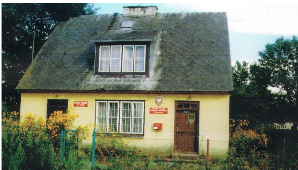
Budynek, w którym mieściła się filia biblioteczna w Olszewnicy

W 1959 r. powstają też punkty biblioteczne, których liczba zmienia się w kolejnych latach. Rok później zostaje utworzona kolejna Filia biblioteczna w miejscowości Olszewnica .