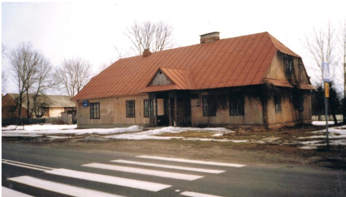
Budynek Gromadzkiej Rady, w którym mieściła się biblioteka w latach 1969-1977

W 1969 r. biblioteka po raz kolejny zmienia swoją siedzibę, zostaje przeniesiona do budynku po Gromadzkiej Radzie, zajmuje jedno pomieszczenie o pow. 16 m 2 . W tym czasie zarejestrowanych jest w bibliotece około 600 czytelników.